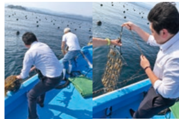
あこや貝の稚貝が母貝に育つまで手入れし、美しい真珠を育てます。

10月2日(金)～5日(月)のみ有効 お手持ちのパールネックレス・指輪 新品仕上げ 無料券 糸変え